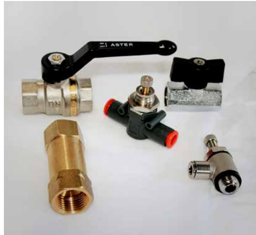
Ventile & Absperrorgane Rückschlagventil - Drosselrückschlagventil Durchflussregler - Kugelhahn