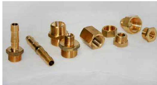
Standardverschraubungen Reduziernippel - Verschlussstopfen - Doppelnippel Muffe - Einschraubtülle - Schlauchtülle