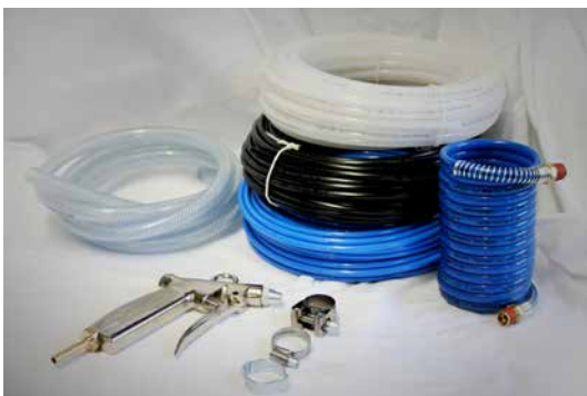
Schläuche & Zubehör Polyamidschlauch PA - Polyethylenschlauch PE Spiralschlauch PA - PVC-Gewebeschlauch Schlauchschelle - Ausblaspistole - Zubehör