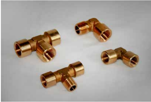
Anschlussstücke & Verschraubungen Winkelstück - T-Stück