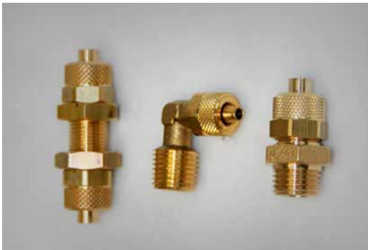
Schottverschraubung Gerader - Winkel - Einschraubverschraubung Schottverschraubung