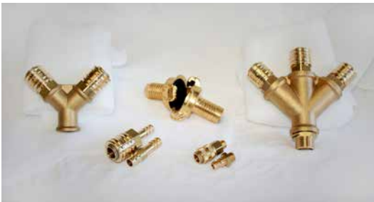
Schlauchkupplungen Schnellverschlusskupplung - Stecknippel Verteiler - GEKA Kupplung