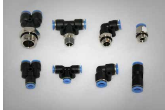
Schnellsteckverbinder Gerader - Winkel - T- und Y-Verbinder Reduktionen Gerader - Winkel - T- und Y-Einschraubverbinder