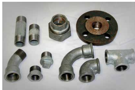
Tempergussfittings Bogen 45° / 90° - Winkel 45° / 90° Doppelnippel - Stopfen - Gewindeflansch