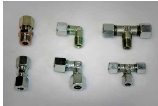
Schneidring-Verschraubung Gerader - Winkel - T-Verschraubung