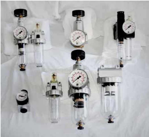
Wartungsgeräte Druckregler - Filterregler - Filter - Nebelöler Wartungseinheiten - Pneumatik-Öl

Pneumatik sind die technischen Anwendungen, bei denen Druckluft dazu verwendet wird, Arbeit zu verrichten. Die nachfolgenden Pneumatik-Artikel haben wir ständig auf Lager. Wir können ebenso jederzeit alle Riegler, Festo und Camozzi Artikel bestellen.